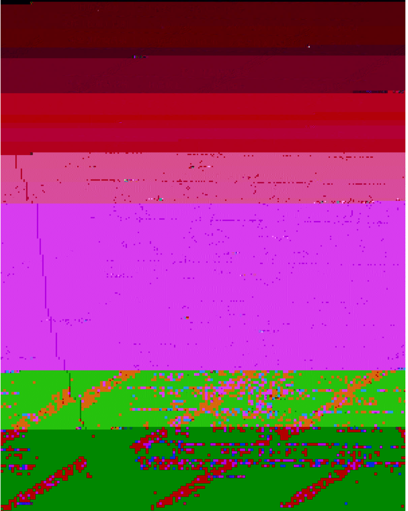
表 1. 基本情况描述